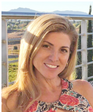
Hope Bundrante Cofundador - Dir.